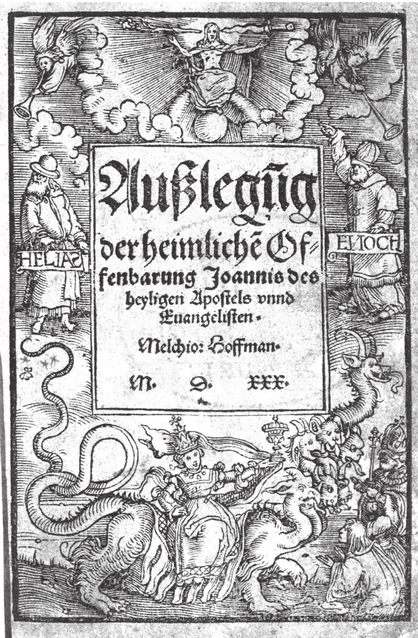
Abbildung 2. Titelblatt mit Holzschnitt der Außlegung der heimliche Offenbarung Joannis des heyligen Apostels vnnnd Euangelisten (derselbe Holzschnitt zierte auch die aus demselben Jahr stammende Schrift Prophetische gesicht vñ Offenbarung ). In der rechten unteren Ecke ist der Kaiser bei der Anbetung der auf dem Drachen reitenden Babylonischen Hure abgebildet.